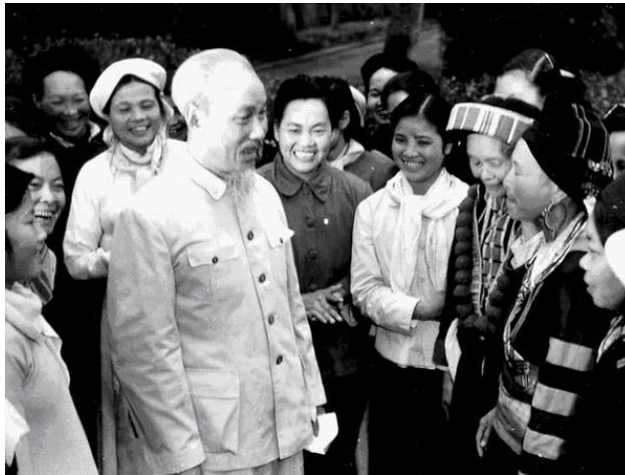
Hình ảnh minh họa